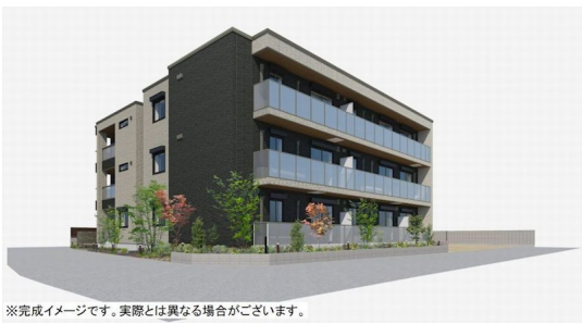
※完成イメージです。実際とは異なる場合がございます。